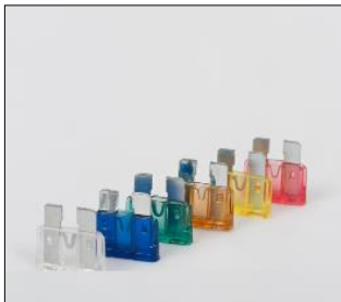
Bıçaklı Sigorta (Ürün Kodu : S2XXX)