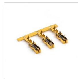
Çelik Takviye Yaylı Terminal (Ürün Kodları : T9071HD-T9072HD)