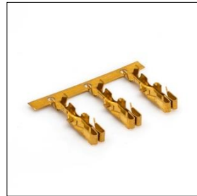
Yandan Yaylı Terminal (Ürün Kodları : T9071-T9072)