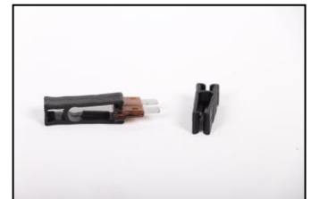
Sigorta Maşası (Ürün Kodu : FH6001)