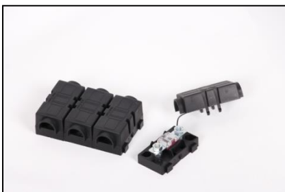
MidiTip Sigorta Kutusu (Ürün Kodu : FH1001)