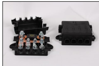
Kombi Sigorta Kutusu (Ürün Kodları: FH1005-A & FH1005-B)